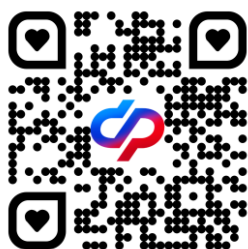
Социальный фонд России