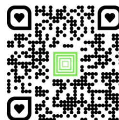
Центр социальных выплат