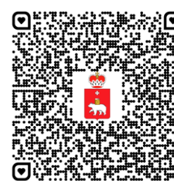
Минтруда и соцразвития Пермского края